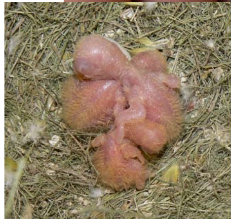
nidada de lutinos mascara naranja (José M a Terrada)

-Cuarto acoplamiento: verde/ino/mascara naranja x verde mascara naranja