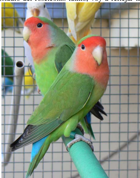
Roseicollis clásico (José María Terrada)fig1

-Su localización se sitúa en África suroccidental habitualmente regiones secas cerca del agua, a menudo se observa en bandadas y se reúnen a cientos donde abunda la comida, sobre todo las cosechas siendo un gran problema para algunos cultivos de la zona como maizales, triguales, etc.