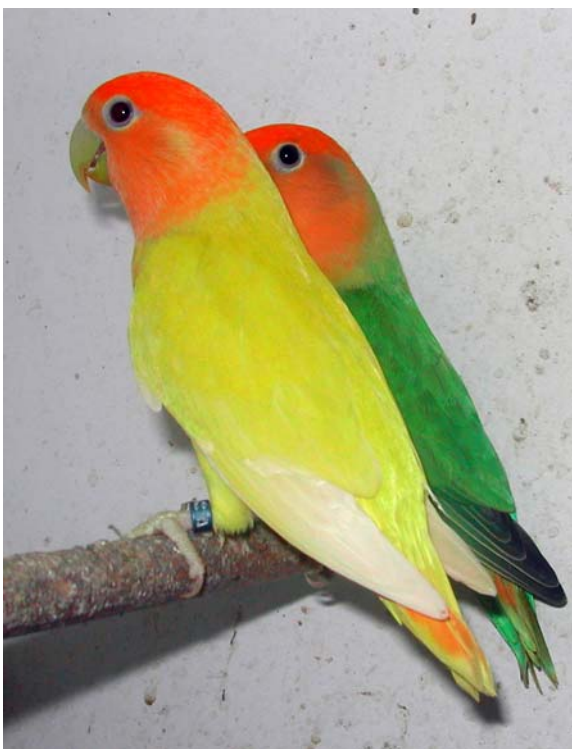
Fig2 lutino y verde opalino mascara naranja