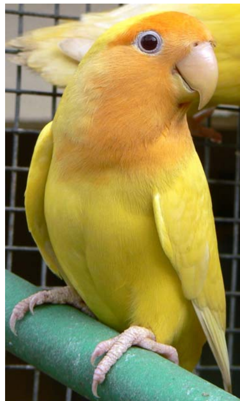
Lutino mascara naranja

-Quinto acoplamiento: verde/ino/mascara naranja x lutina mascara naranja